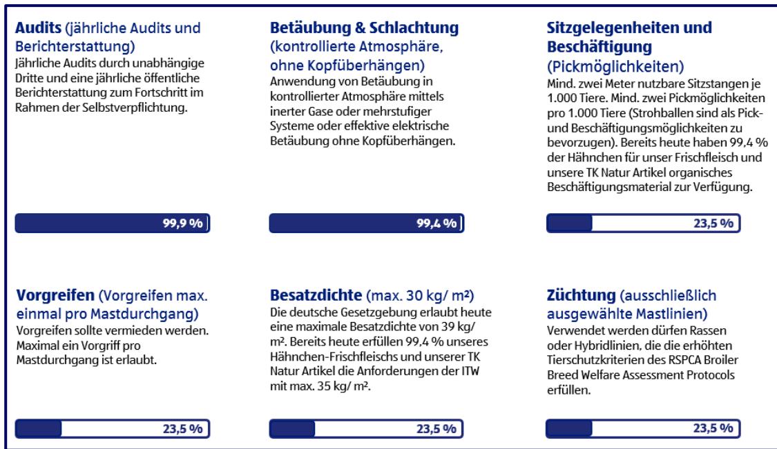
Fortschritt Hähnchen-Frischfleisch und Hähnchen TK Natur Artikel in %-Anteil Tonnage

und unsere Hähnchen-Wurstwaren aus den Haltungsformen 3 und höher entsprechen bereits den Anforderungen der EMI. Mit dem Fortschrittsbericht zeigen wir auf Basis der einzelnen EMI-Kriterien unsere Umsetzungserfolge aus dem Jahr 2025: